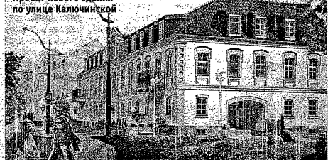
Проект нового здания по улице Калючинской

Ресторан обещают построить до конца 2020 года. Кстати, расположенные на месте будущей стройки деревья будут пересажены специальной техникой «роднозеленстрой».